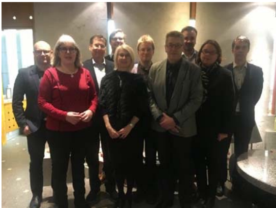
Hallitus ja toimitusjohtaja vuoden viimeisen kokouksen jälkeen 1.12.2017